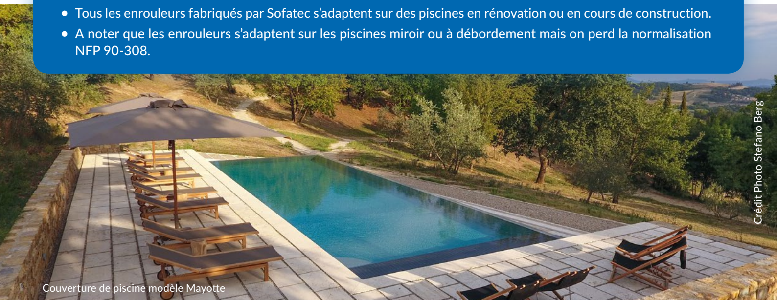
Couverture de piscine modèle Mayotte